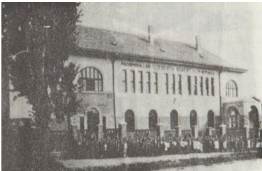
5. ábra: A bővített iskola 1927 Figure 5. The enlarged school building in 1927.