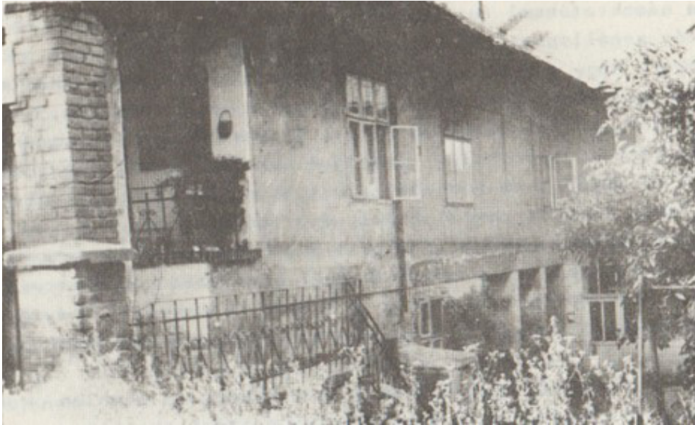
3. ábra: A Becker-féle ház 1920-ban Figure 3. The so-called Becker-house in 1920