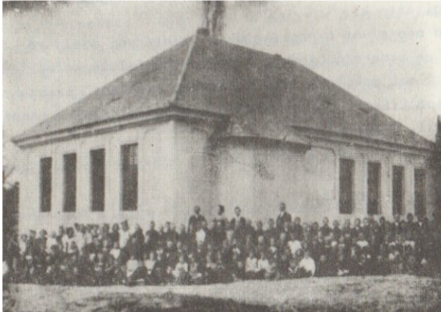
Forrás: Joó, 1977 p. 10. Source: Joó, 1977 p. 10.

Az új iskolát 1924 áprilisában nagy ünnepség keretében adták át, melyről a Dunántúl is beszámolt: