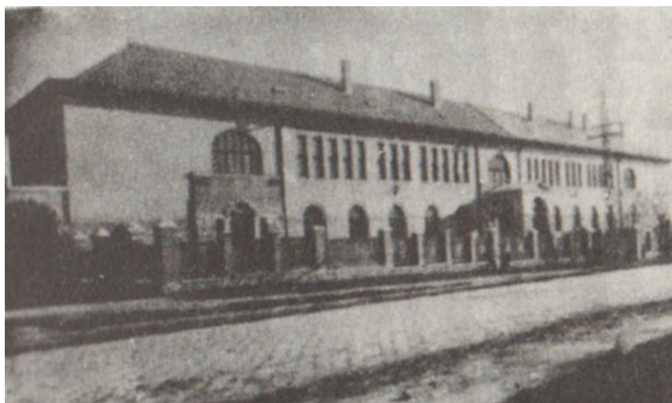
6. ábra: A bővítés III. üteme 1935 Figure 6. The third stage of the enlargement in 1935

Forrás: Joó, 1977, p. 23. Source: Joó, 1977, p. 23.