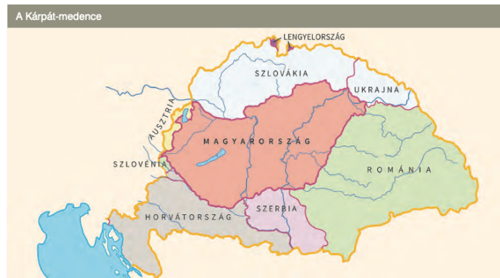
4. ábra: Kárpát-medence területi megoszlása az első világháború után Figure 4. Territorial distribution of the Carpathian Basin after the First World War