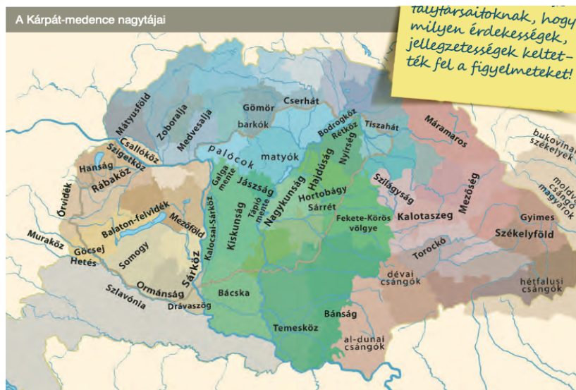
5. ábra: Nagytájak Kárpát-medencében Figure 5. Large landscapes in the Carpathian Basin